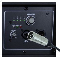
Instrução de Conexão do Cabo de Sinal XLR