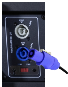
Instrução de Conexão do Cabo de Alimentação

3. Conexão do cabo de sinal: Certifique-se de que o botão de volume está na posição mínima antes de conectar. Conecte o cabo de sinal XLR (conecte na parte inferior para obter uma boa conexão e não folgar).